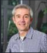
Redactie: Richard Stegers