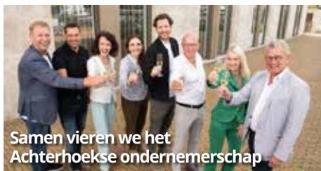
Samen vieren we het Achterhoekse ondernemerschap