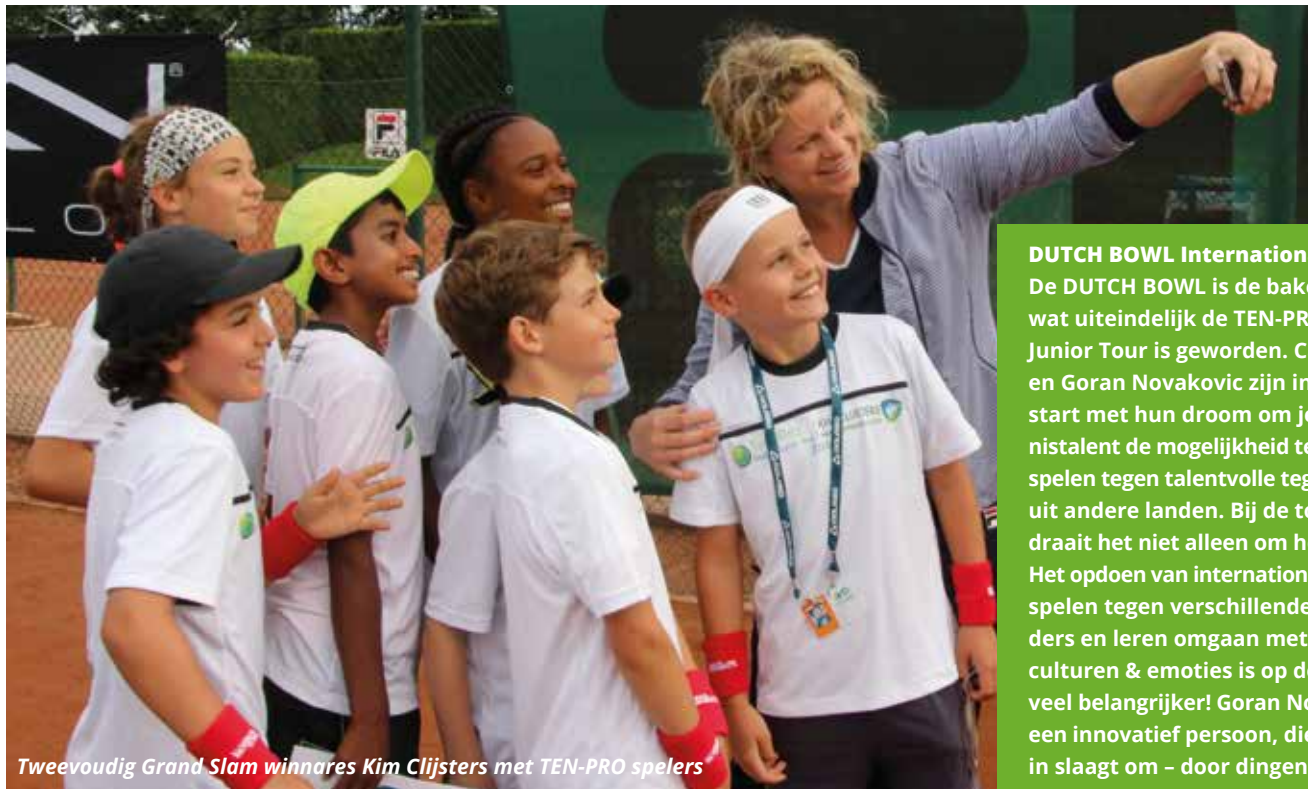
Twelvoudig Grand Slam winnares Kim Clijsters met TEN-PRO spelers

innovatief tennistoernooi voor jeugdige talent uit Europa en daarbuiten?”