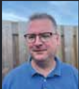
Redactie: Walter Hobelman