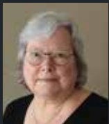
Redactie: Carla van der Meer