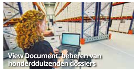
View Document: beheren van honderdduizenden dossiers