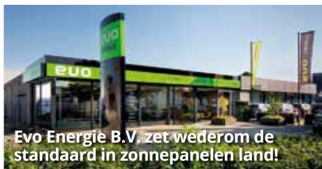
Evo Energie B.V. zet wederom de standaard in zonnepanelen land!