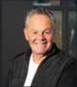
Hoofdredactie: Ed Smit